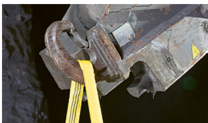
1 Dispositivo di aggancio

Prima di istruire il personale controllate gli accessori di imbracatura e i punti di aggancio sulle macchine edili. Spiegate quali sono i carichi più frequentemente trasportati sul cantiere. Spiegate le varie fasi di lavoro e le regole per il trasporto di carichi con le macchine edili.