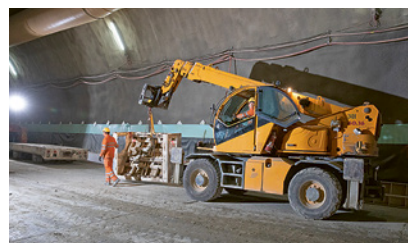
3 Trasporto di un carico con macchina edile