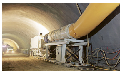
2 Misure tecniche di riduzione delle polveri