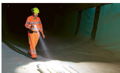
2 Illuminazione di emergenza con la lampada di sicurezza