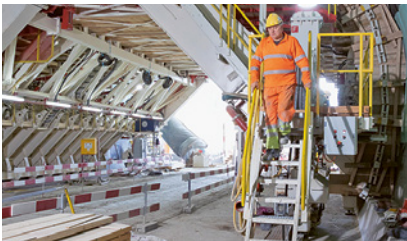
1 Scala fissa con corrimano

Passate in rassegna i diversi accessi ai posti di lavoro in altezza. Esempi: installazioni sui paramenti, condotte di aerazione in calotta, rivestimento di calcestruzzo, consolidamento della cavità (ancoraggi, reti, centine ecc.). Per l'accesso ai pozzi occorre impiegare una torre-scala o un impianto di trasporto specifico per pozzi. Mai improvvisare!