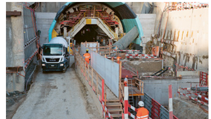
3 Chiara separazione tra vie pedonali e carreggiata