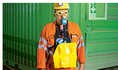
3 Addestramento all'uso dell'autorespiratore