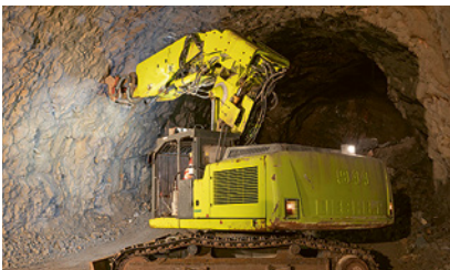
1 Impiegare attrezzature idonee

Al fronte di scavo effettuare un disaggio accurato mediante l'escavatore. Lavorare solo in zone messe in sicurezza. Illuminare adeguatamente la zona di lavoro.