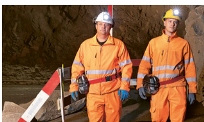
1 Usare sempre i DPI necessari

Se c'è un pericolo di intossicazione da fumo, occorre avere con sé un autorespiratore.