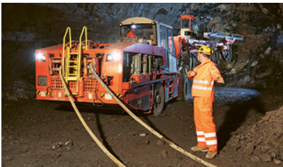
1 Mantenere il contatto visivo con il macchinista

Non sempre il macchinista è in grado di avere sotto controllo tutta la zona operativa.