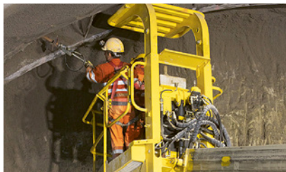
2 Applicare le misure a partire da un luogo sicuro