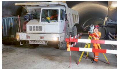
2 Segnaletica presente anche per i lavori di breve durata