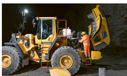
2 Manutenzione della macchina edile secondo le indicazioni del fabbricante