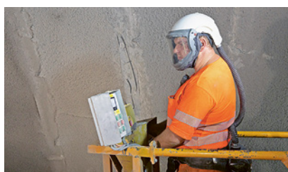
2 I DPI vanno scelti in base ai pericoli