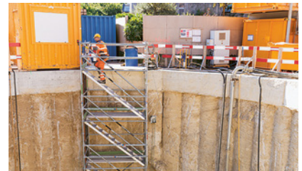
3 Accesso al posto di lavoro tramite torre-scala