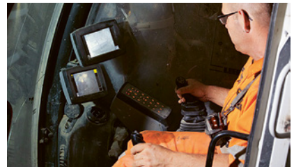
3 Macchina edile con videocamera posteriore

Attenzione nella zona di pericolo delle macchine edili!