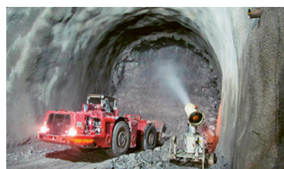
3 Abbattimento ad acqua