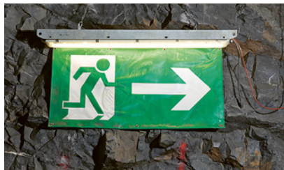
2 Segnaletica per le vie di fuga