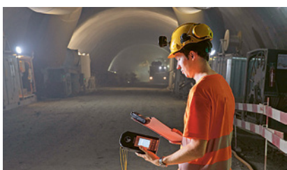
1 Misurazioni regolari della qualità dell'aria

La composizione dell'aria sul luogo di lavoro non deve nuocere alla salute. Se non è così, bisogna provvedere a una ventilazione naturale o artificiale e monitorare regolarmente la qualità dell'aria.