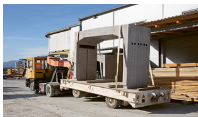
2 Carichi messi in sicurezza correttamente