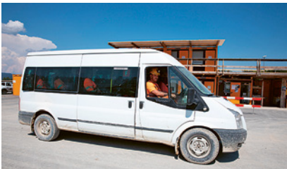
1 Trasporto di persone con il bus di cantiere

È indispensabile separare in modo chiaro le vie pedonali da quelle in cui circolano i veicoli. La separazione deve avvenire con mezzi tecnici e, nell'impossibilità, adottando misure organizzative.