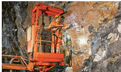
2 Uso di una piattaforma di lavoro elevabile per i lavori in altezza