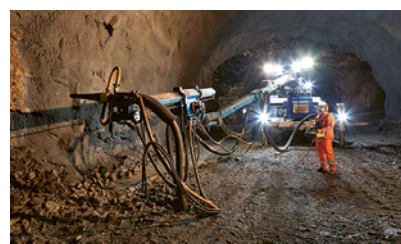
3 Illuminazione sul posto di lavoro

Gli indumenti ad alta visibilità sono vitali!