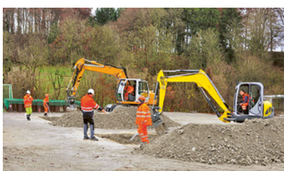
1 Formazione per la guida delle macchine edili

Manovrare macchine edili ed apparecchiature è un'attività particolarmente pericolosa. Alla guida di questi macchinari deve essere impiegato solo personale appositamente formato.