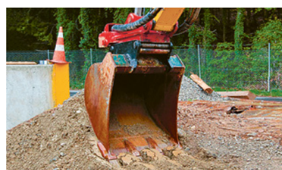
3 Fare il test di contropressione per i sistemi di attacco rapido